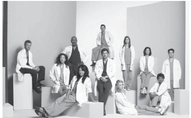
▲以醫院為背景，一位年輕女醫生為主角，描述外科醫生如何從實習開始一步步往上爬的《實習醫生》。

「戲劇神學」是一種新的系統神學架構，由戲劇的角度剖析聖經，重新詮釋基督信仰。它最基本的假設是：聖經是一部正常完整的戲劇作品，有一位惟一的創作者，縱使因為編劇團隊與編輯團隊時