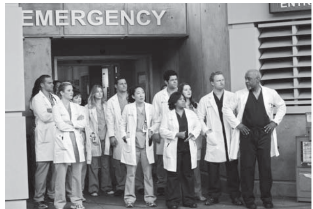
▲演員生殺大權，都握在看不見的創作者手中。