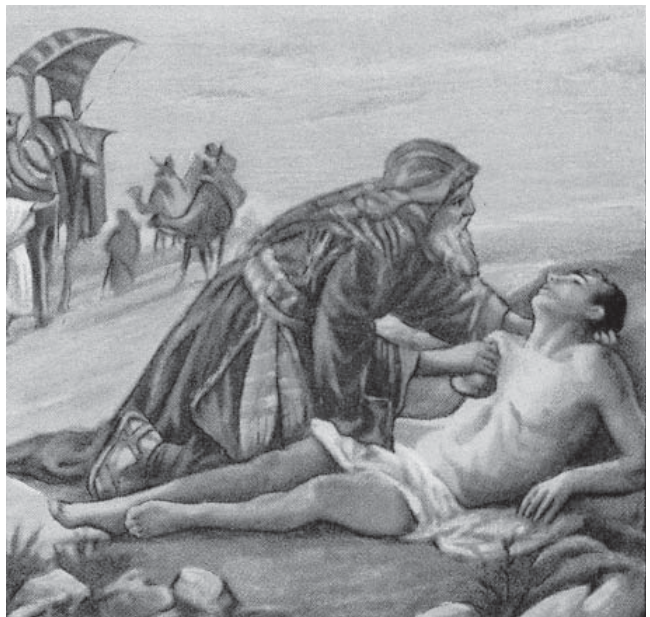
▲耶穌用許多故事及比喻幫助門徒認識神的國：好撒馬利亞人、浪子回頭、牧人尋迷羊等等。這些鮮活生動的故事讓歷代基督徒大受激勵，難以忘懷。