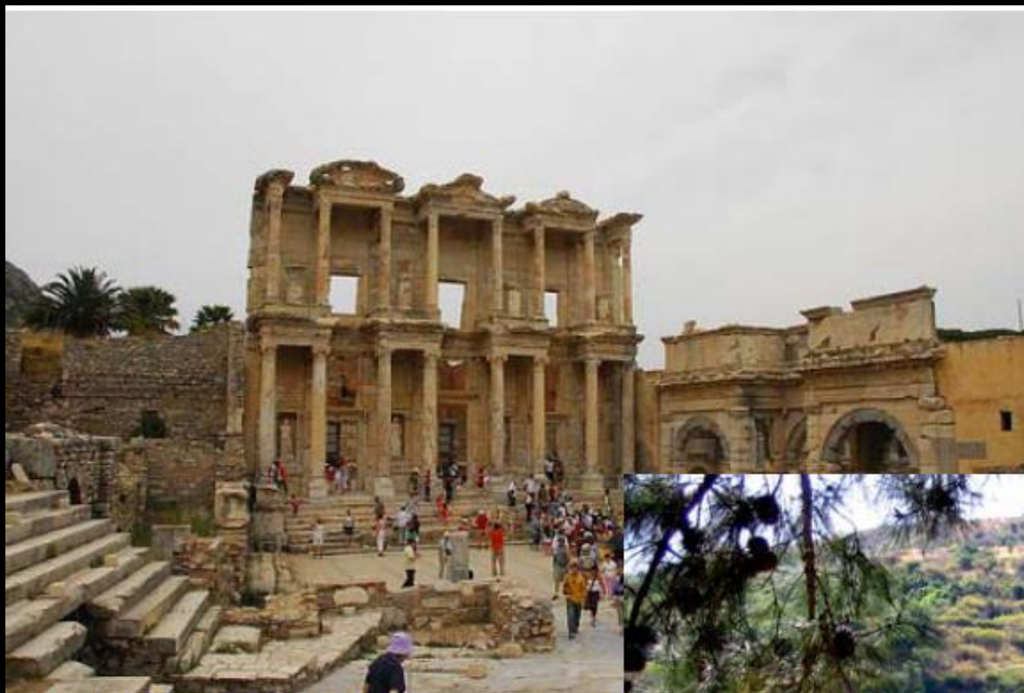
大女神亞底米的廟