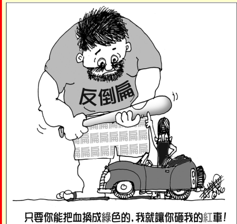
只要你能把血換成綠色的,我就讓你碾我的紅車!